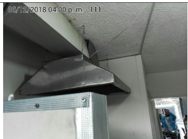
FOTOGRAFÍAS N°.5 Y 6 SISTEMA DE EXTRACCIÓN SOBRE LAS FUENTES