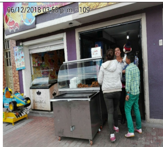
FOTOGRAFÍAS N° 1 Y 2 FACHADA DEL PREDIO Y USO DE ESPACIO PÚBLICO.