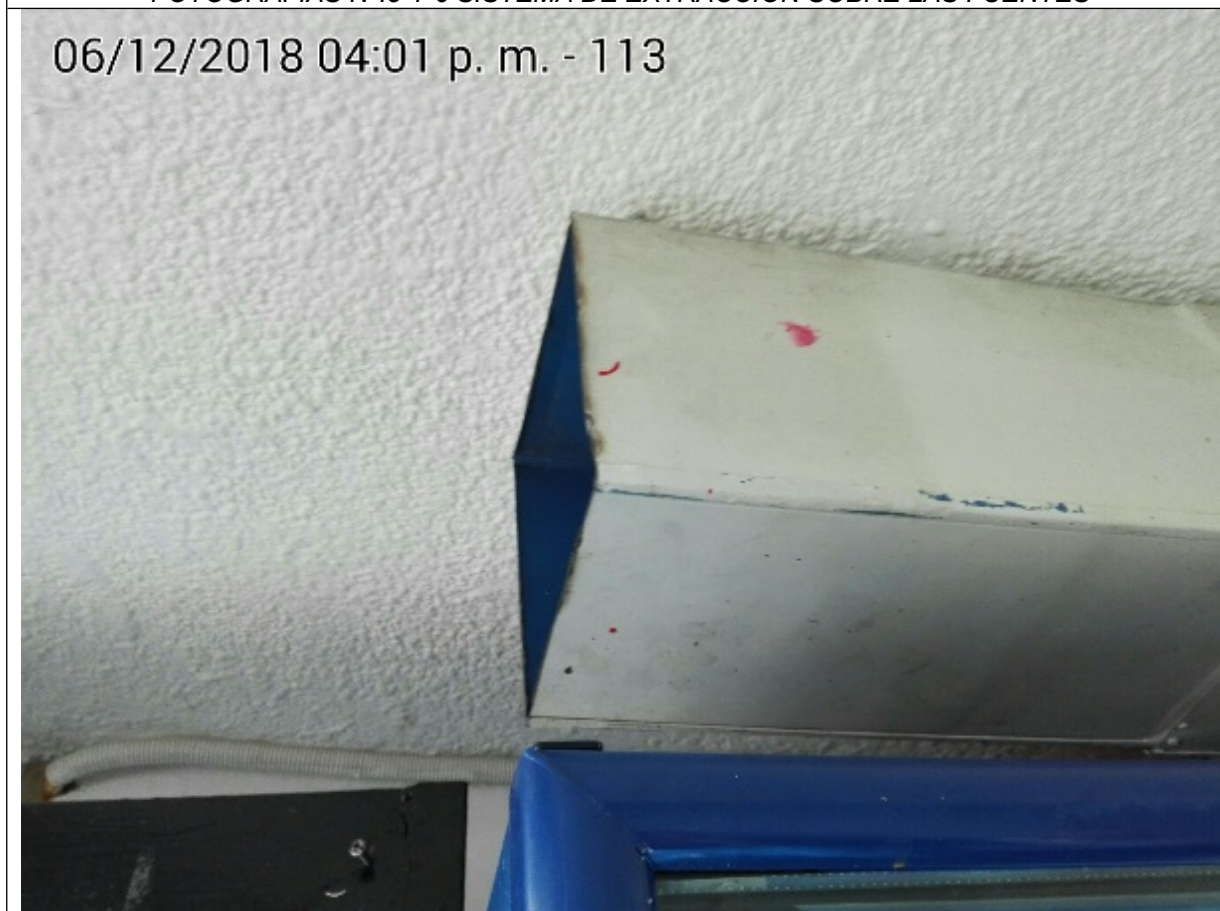
FOTOGRAFÍA N°.7 DUCTO DE DESCARGA DE EMISIONES